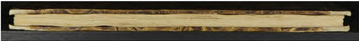
Magl. M.7.28 (a)